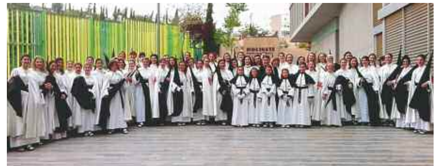
Tercio del Santo Amor de San Juan