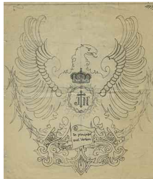
Escudo de Mas y Mustieles

Posiblemente debido a la carencia de medios técnicos para reducir a escala, al águila que se borda en el sud-