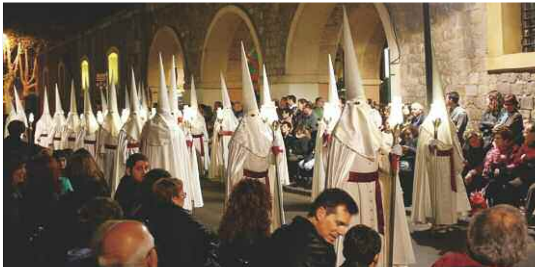
Tercio de la procesión del Santo Entierro desfilando por la calle del Parque. L. Carbonell