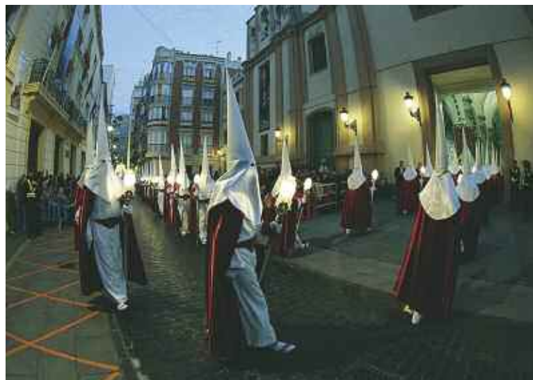
Tercio de la procesión del Encuentro entrando en Santa María de Gracia. Pablo Sánchez

En 1998, durante una comida de las que realizamos varios sanjuanistas cada Jueves Santo, nos propusimos introducir al trono en esa peculiar salida. El hecho de