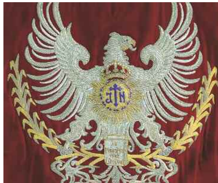
Representación del escudo de la Agrupación

La junta general de la Agrupación de San Juan celebrada el 13 de septiembre de 2014 decidió por amplia mayoría, aprovechando que se iba a realizar una intervención profunda en dicho sudario, sustituir el águila que actualmente aparece en el sudario de 2006 por el emblema de la Agrupación.