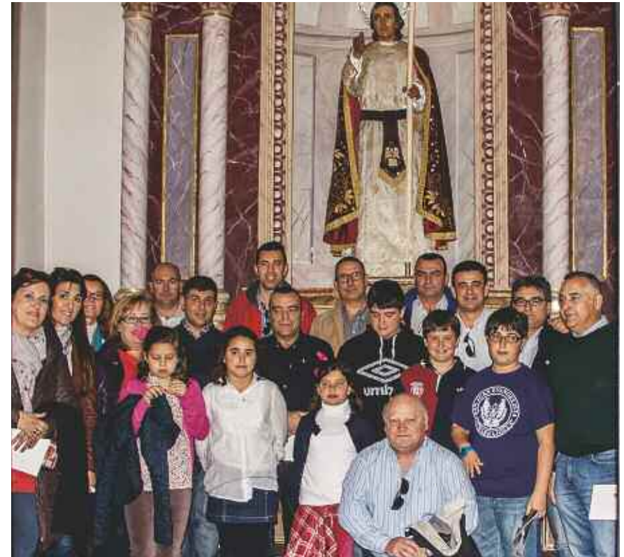
Recuerdo de la visita al San Juan Evangelista, obra de José Alfonso Rigal, que perteneció a la Cofradía Marraja

Nuestro querido 2014 va haciéndose mayor y con los tercios formados, los grupos de portapasos preparados y los vestuarios colgando en los guardarropas de los hermanos esperando el momento de acompañar a San Juan, se celebró la tradicional cena de hermandad con gran asistencia de penitentes, portapasos,