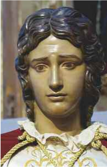
San Juan Evangelista. M. Maturana