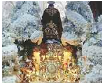
Trono de San Juan