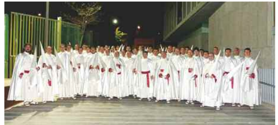
Tercio de penitentes de la procesión del Santo Entierro