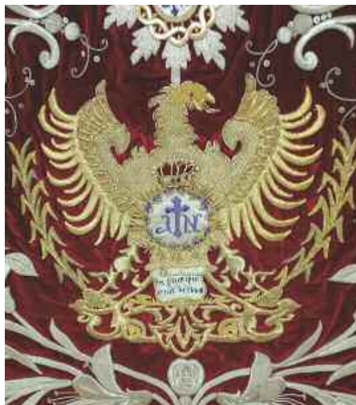
Escudo de 1972, en el estandarte de la Madrugada

En el año 2006 la reproducción del sudario se realizó con gran dili-