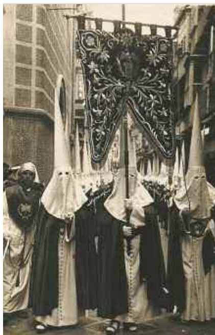
Estandarte original de la Madrugada