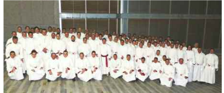
Grupo de caballeros portapasos de San Juan Evangelista, para la procesión del Santo Entierro