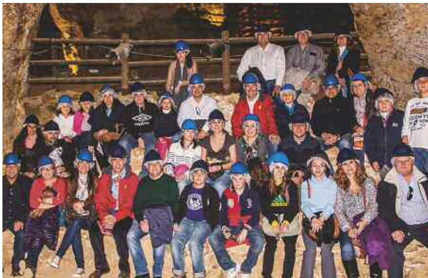
Visita a la Mina Agrupa Vicenta, de La Unión