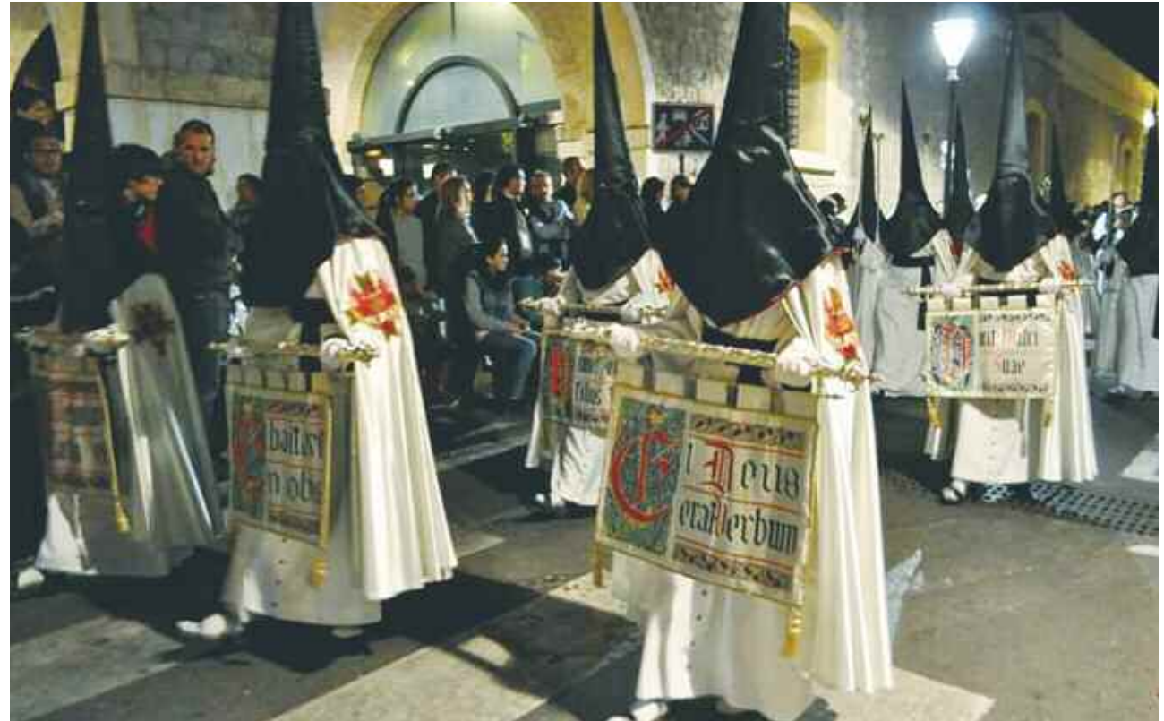
Penitentes del Santo Amor de San Juan. JM Sánchez

Ese paralelismo se hace especialmente visible si comparamos el manto del caballero con la capa del penitente. Con carácter general, casi todas las agrupaciones de las principales cofradías visten con capa, como los caballeros medievales, en la que llevan bordado el emblema, a semejanza del escudo heráldico, pero son muy pocas las que mantienen el verdadero significado de su posición en el lado correcto, la siniestra, buscando quizás más el lucimiento que el sentido profundo que guarda en su esencia.