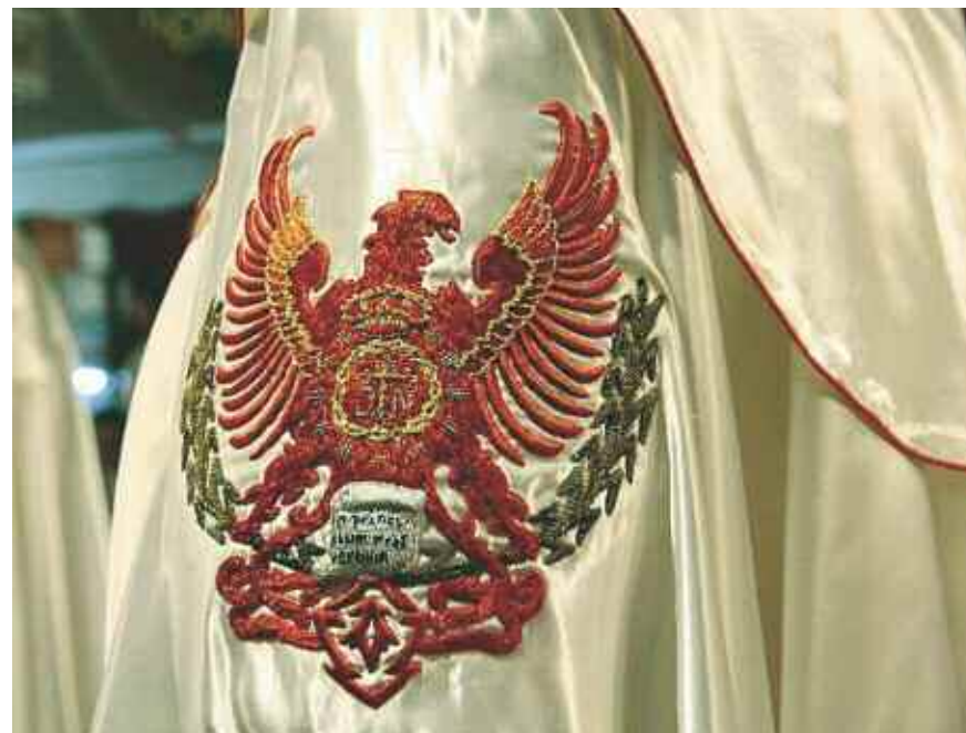
Primer plano del escudo.

“Hagamos un viaje en el tiempo. Vamos a regresar a la baja Edad Media, a ponernos nuestra vieja cota de malla, el yelmo, las calzas y nuestras mejores vestimentas de caballero”