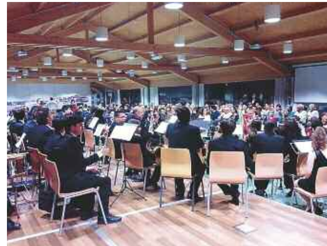
Concierto de presentación del nuevo CD de la Agrupación

del mismo, mientras los demás participantes y acompañantes disfrutaban de una agradable mañana de convivencia.