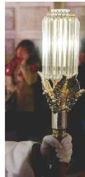
Prisma. A. Ballester

“ La Iglesia no es una ONG, nos decía el Papa Francisco, y eso es lo que distingue a la simple beneficencia de la caridad cristiana: ésta última sabe que la mayor carencia del hombre es no tener a Dios”