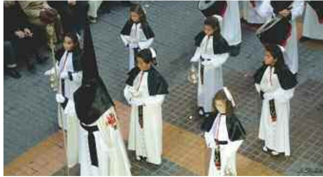
Monaguillas del tercio del Santo Amor de San Juan. A. Ballester.