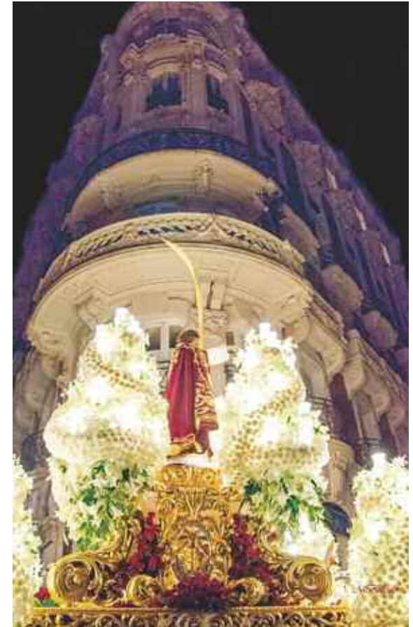
Trono de San Juan pasando por el Gran Hotel