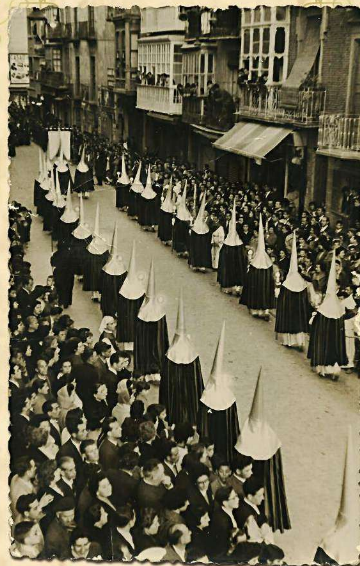
Fotografía para el recuerdo Tercio de San Juan Evangelista en una mañana de Viernes Santo desfilando por la calle del Puque. Años 50.

“La Semana Santa de 2019 quedará como una de las más tristes para los marrajos: la procesión del Encuentro tuvo que adelantar su salida y dos de nuestras procesiones, la del Santo Entierro y la del Sábado Santo, no pudieron salir a la calle»