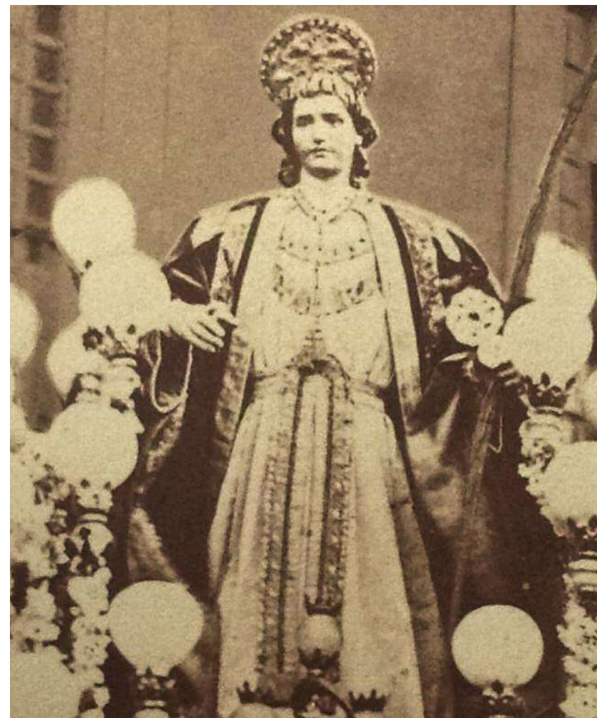
San Juan de Salzillo. Año 1880. Se puede apreciar cómo todo el cabello que cae sobre la frente dispone de un volumen importante