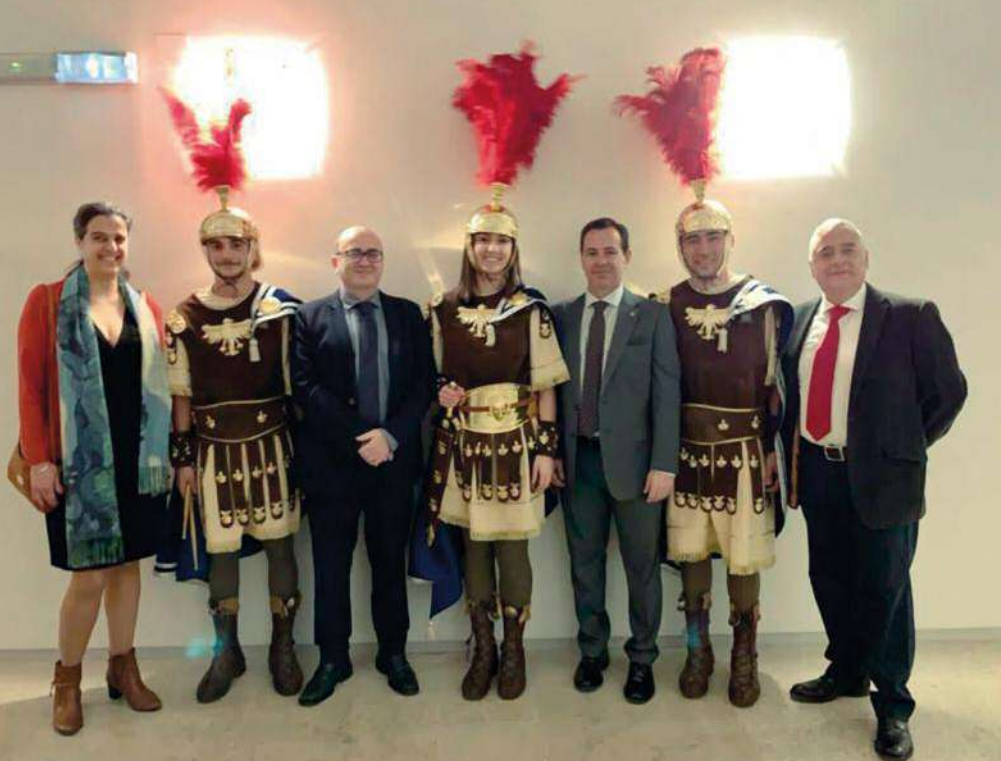
Nuestros sanjuanistas con el Presidente de la Junta de Cofradías de Cuenca y los músicos de U.M. Cartagonova.

mes de julio de 2017, reuniéndonos con su director, así como la junta directiva de U.M. Cartagonova. La idea les encantó, sobre todo la posibilidad de participar en una de las grandes ciudades de la música procesional española, así como, la posibilidad de grabar un disco del concierto. Finalmente, el concierto se concedió para la cuaresma de la semana santa de 2019, ya que la de 2018, finalmente la realizó la Banda de Música María Santísima de la Victoria “Las Cigarreras” de Sevilla.