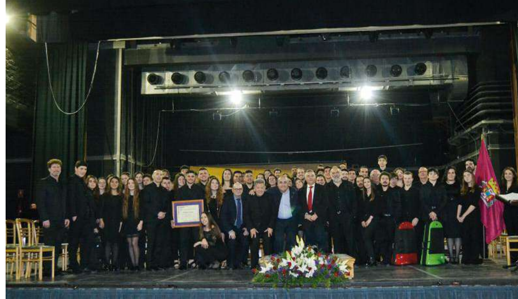
Unión Musical Cartagonova junto con nuestros hermanos sanjuanistas a la finalización del concierto.