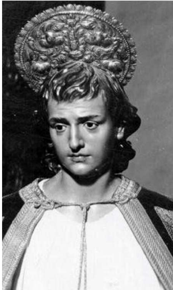
San Juan Marrajo década 1920. El volumen del pelo que se puede apreciar en la anterior ha desaparecido

Todos estos datos me hacen reflexionar sobre un periodo de la Semana Santa de Cartagena del que sabía muy poco y conforme voy profundizando en su estudio confieso que desconozco cada día más cosas. Pensar en la importancia que en estos años, tras la reconstrucción y el empuje proporcionado tras la contienda cantonal tienen las cofradías, gracias a aquellos mecenas/comisarios que eran capaces de costear la flor artificial en la casa más prestigiosa de