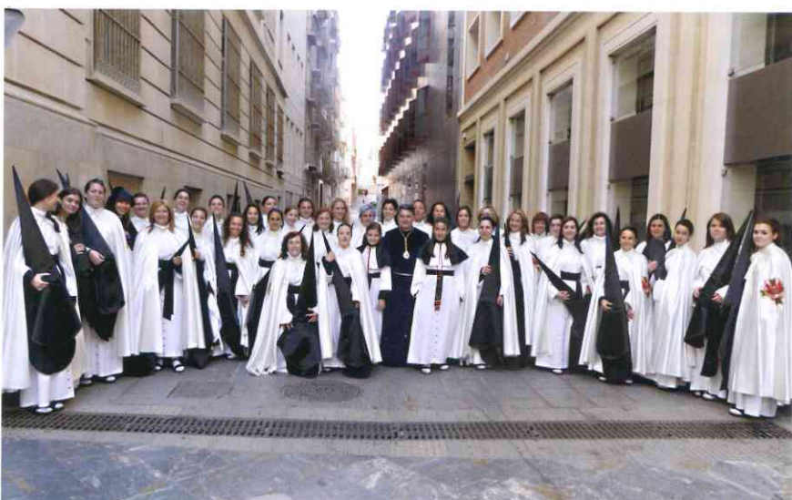
Penitentes del tercio del Santo Amor de San Juan, en la convocatoria previa a su salida en la procesión del Sábado Santo de 2012