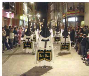
Sudario del tercio del Santo Amor de San Juan. Sábado Santo.