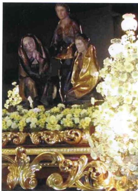
Detalle del trono y grupo del Santo Amor de San Juan. Sábado Santo.