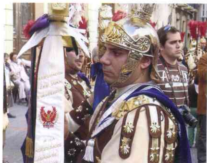
Corbatín de San Juan Marrajo en el lábaro de la Agrupación de Soldados Romanos de la Cofradía Marraja