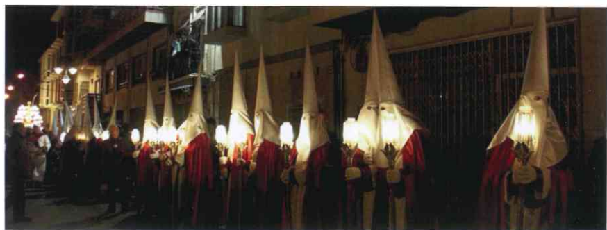
Tercio y trono de San Juan para la celebración del 'Encuentro'. Madrugada de Viernes Santo