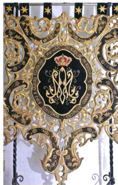
Reverso del sudario