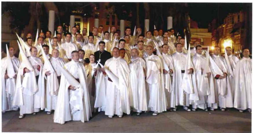
Tercio de penitentes, en la Glorieta de San Francisco, antes de la procesión del Santo Entierro' Viernes Santo de 2012