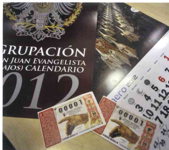
Calendarios y décimo de lotería del Niño de 2012

“La presencia en los medios de comunicación de San Juan Marrajo es importante para mantener viva la tradición”