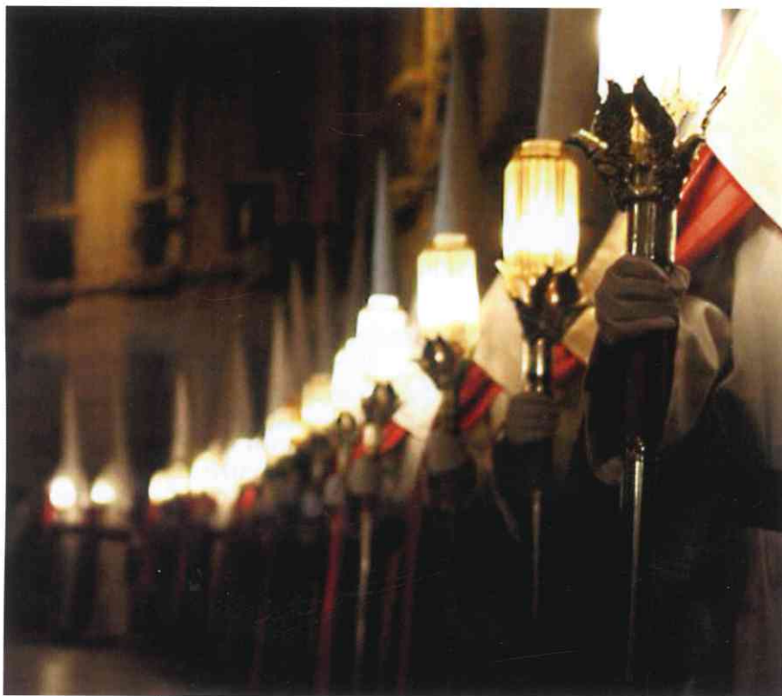
Tercio de la madrugada desfilando con los 'prismas'