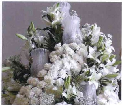
Detalle arreglo cartela