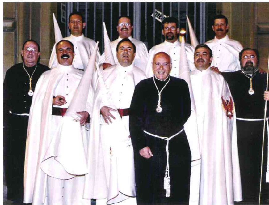
2001. Penitentes que desfilaron en las Bodas de Oro (1976) y en las de Platino (2001)

“ El tercio hizo una rectificación de casi 180 grados en forma de V que salió perfecta ante la sorpresa y la admiración de la gente que nos seguía ”