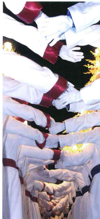
Portapasos de San Juan estrechan sus manos con las de los portapasos de la Pequeñita en el Encuentro

“Nunca, jamás, aún imberbe, había visto discutir acaloradamente a ninguna persona adulta hasta ese día”