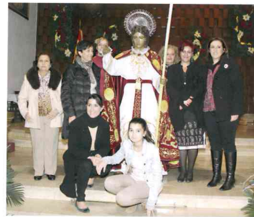
Junta de Damas de San Juan, con el Santo, tras la vestida en la víspera de la onomástica.

Otra de nuestras funciones es la elección de la Palma de Oro, el máximo galardón de la Agrupación, que se elige de forma democrática en una junta que se convoca al efecto, decisión que se toma junto con el presidente, según el Reglamento de la Agrupación. Este año convocamos la junta para el día 21 de febrero. Posteriormente organizamos la cena de la Agrupación, en colaboración con el vicepresidente de Protocolo, en la que entregamos no sólo la Palma de Oro, con la lectura de la semblanza por parte de la secretaria de la Junta de Damas, sino también la entrega del resto de trofeos por las actividades deportivas y otros reconocimientos. Este año 2013 la cena se celebrará el día 23 de marzo en el Hotel Alfonso XIII.