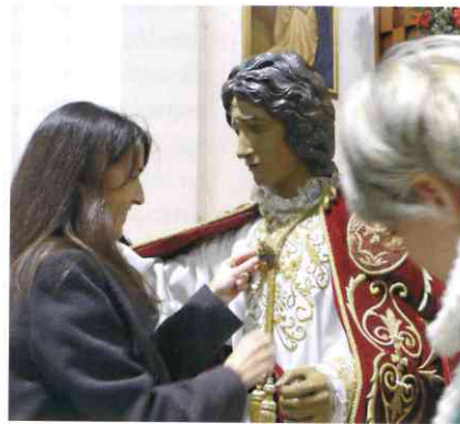
Acto de vestir a San Juan en la víspera de su onomástica