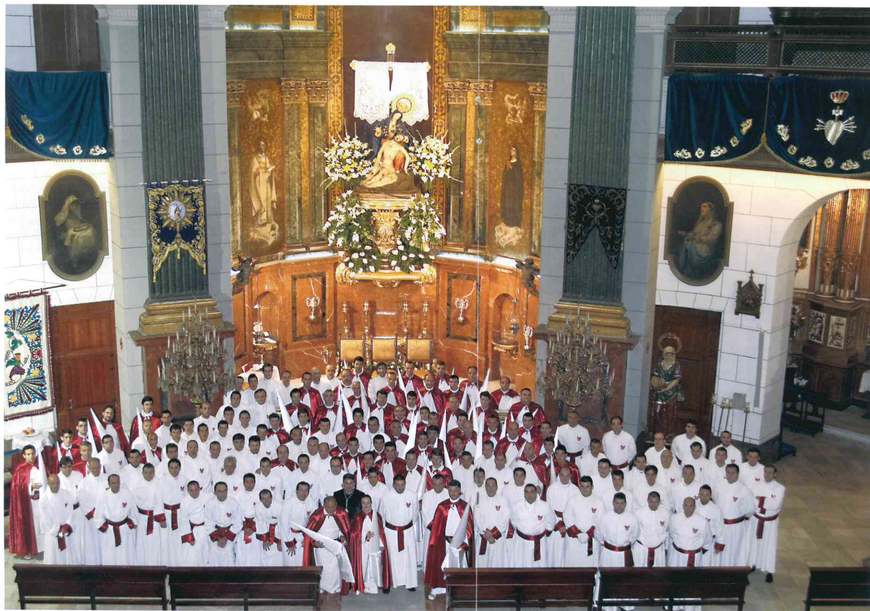
Penitentes y portapasos en la iglesia de la Caridad, antes de la salida en la procesión del Encuentro'. Viernes Santo de 2012