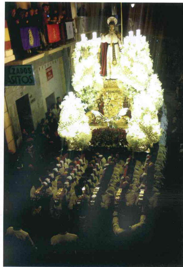
Trono de la noche del Viernes Santo, tras la reforma