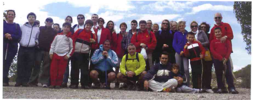
Participantes en la excursión al monte de La Muela, en noviembre.

En el capítulo deportivo, también en noviembre tuvo lugar el campeonato de fútbol sala entre miembros de San Juan y está pre-