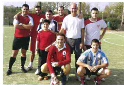
Hermanos participantes en el partido de fútbol celebrado en el polideportivo de Santa Ana

Desde la Vocalía de Actividades se invita a todos los hermanos de la Agrupación de San Juan Evangelista a participar en las actividades, así como a proponer otras que puedan ser de interés para todos nosotros. ■