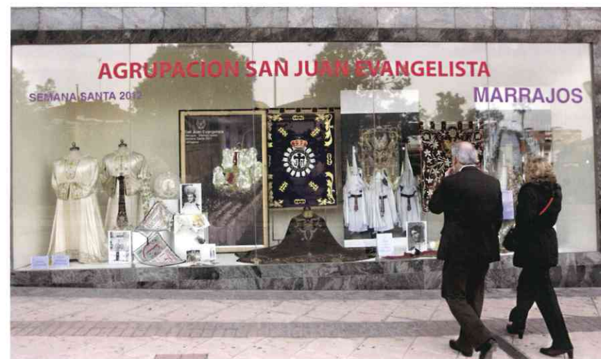
Escaparate que El Corte Inglés dedicó a San Juan Marrajo

por el artista Aladino Ferrer. Esta operación ha permitido añadirle una vara más para mejorar la distribución del esfuerzo entre los 140 portapasos que necesitará para ponerlo en la calle', contó el diario decano de Cartagena en su edición del día 24 de marzo de 2012, resaltando el éxito de la reforma del trono y la existencia de lista de espera para llevar a nuestro Titular en la gran procesión de los marrajos.