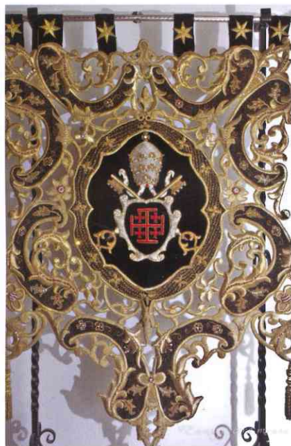
Frontal del sudario de Huércal-Overa