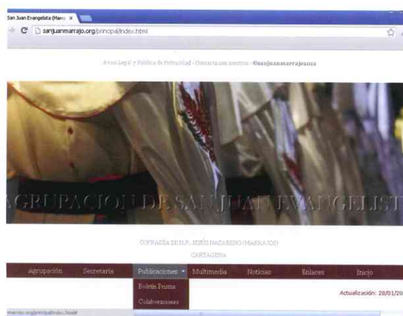
Página web de San Juan Marrajo ( www.sanjuanmarrajo.org )

La presencia en los medios de comunicación de San Juan Marrajo es importante para mantener viva la tradición y la difusión de los misterios de la Pasión, Muerte y Resurrección de Jesús a través de la vi-