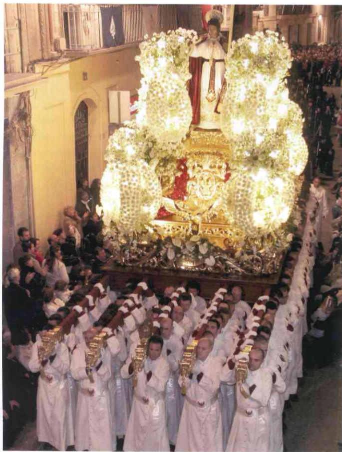
Trono del Viernes Santo por la noche, antes de la reforma

ido quedando un tanto desfigurado con el paso de los años y las sucesivas reformas: ampliaciones, adaptación al chasis sobre ruedas, nueva adaptación del trono para volver a los hombros de los portapasos, cambios de cartelas, cambios de criterio en el exorno floral... Todas estas intervenciones habían ido provocando el efecto inicial de esbeltez, y desvinculando unos elementos de otros. Tras la devolución al trono de su base de perfil trapezoidal y fondo convexo, el